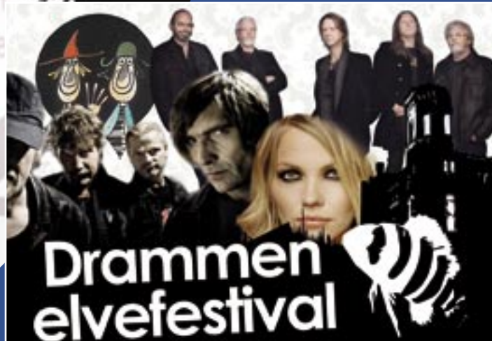
Drammen Elvefestival 2008