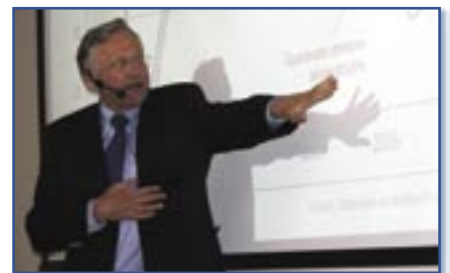
Sentralbanksjef Svein Gjedrem.

Neste års Ypsilonkonferanse kommer til å ha foredragsholdere av samme høye kvalitet.